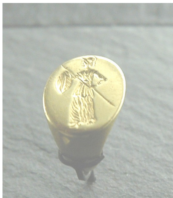
Une bague en or d'Athéna

Qu'aimerais-tu posséder ? Est-ce donc facile pour toi de le posséder ?